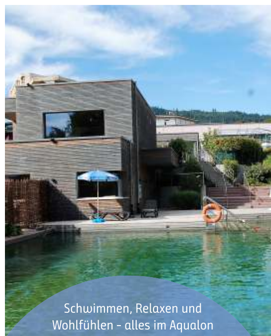
Schwimmen, Relaxen und Wohlfühlen - alles im Aqualon

Ferner gibt es jeden dritten Samstag im Monat die Mitternachts-Therme, die jeweils unter einem anderen Motto steht. Bis eine halbe Stunde nach Mitternacht können die Gäste sich bei Musik und kulinarischen Leckereien bei der Thermen-Sauna-Nacht vergnügen.