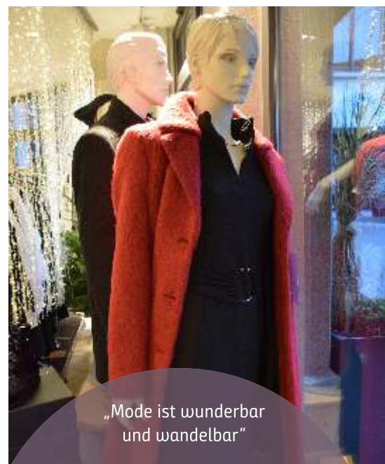
„Mode ist wunderbar und wandelbar“