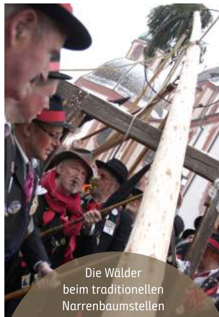
Die Wälder beim traditionellen Narrenbaumstellen

Kursaal oder beim Manöverball der Ranzengarde im Kursaal darf die Männerwelt einen Blick auf die Wiiberschönheiten erhaschen. Am Samstag, 2. März ist Straßenfasnacht in der Altstadt ab 11.11 Uhr, Narrefäscht im Kursaal mit DJ Mark und Special Guest am Abend. Der Fasnachts-samstag lädt zum ausgiebigen Fasnachtstreiben. Abbitte leisten dürfen alle die, die über die Stränge geschlagen haben, am Fasnachtssonntag, 3. März, ab 10.30 Uhr in der berühmt-berüchtigten Narrenmesse mit dem Dekan, dessen närrische Predigt Jahr für Jahr ein echtes Bad Säckinger Narren-Highlight ist. Und dann gibt es am Fasnachtsmäntig trotz Hochrheinnarrentreffen noch einen Umzug. Tradition will gewahrt sein, so das Ansinnen der Narrenzunft, die um 14.11 Uhr zum Start des närrischen Bandwurms pfeift. Wenn dann am Fasnachtsdienstag die kleinen Narren nach dem Kinderball im Kursaal müde in ihren Kissenschlummern, schlägt die große Stunde der Hüüler . Der Umzug der wehklagenden Fasnächtler mit ihren weißgetünchten starren Gesichtern, nur erhellt vom Licht der Fackeln, und die Fasnachtsverbrennung auf dem Rathausplatz mit anschließendem Eckenauslaufen ist eine Zeremonie sondersgleichen – schöner kann die Fasnacht nicht zu Ende gehen als in Bad Säckingen.