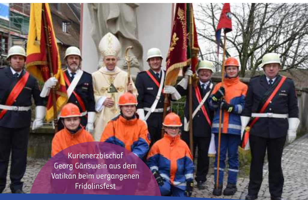
Kurienerzbischof Georg Gänswein aus dem Vatikan beim vergangenen Fridolinsfest

der Stadt getragen wird. Die Prozession durch die Altstadt wird angeführt von Kreuz, Chorfähnlein und Fridolinsfahne. Dahinter folgen eine Abordnung der Feuerwehr, Musikvereine, Trachtengruppen, Statuen, Deutschordensritter, die kroatische und die philippinische Mission, Herolde mit Wappen, Engelsknaben mit Reliquien, die Ritter vom heiligen Grabe zu Jerusalem, Malteser, Diakone und Priester, Vertreter der Stadt, der Kirchen und Schulen und die Ministranten mit dem Schlusskreuz. Im vergangenen Jahr erfreute sich die Stadt Bad Säckingen eines ganz besonderen Zelebranten des Festgottesdienstes: Kurienerzbischof Georg Gänswein aus dem Vatikan krönte den großen Tag. Heuer findet das Fridolinsfest am Sonntag, 10. März, statt. Wer als Ehrengast und Zelebrant erwartet werden darf, ist derzeit noch offen.