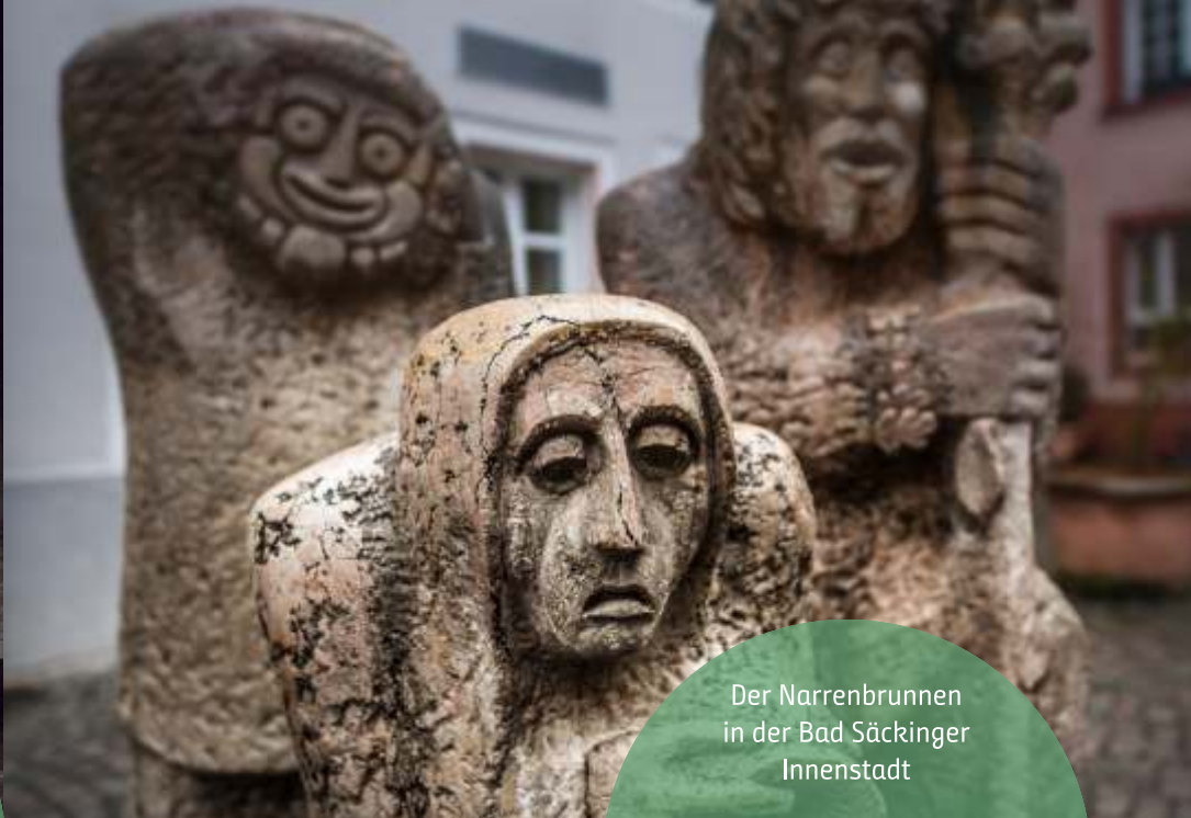
Der Narrenbrunnen in der Bad Säckinger Innenstadt

Es folgt ein Blick auf die epische Charakterkatze Kater Hiddigeigei – ein kautziger Haudegen – welcher Dichter Scheffels Sprachrohr und Übermittler der Zeitanschauung und Skepsis ist.