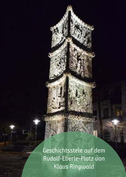
Geschichtsstele auf dem Rudolf-Eberle-Platz von Klaus Ringwald