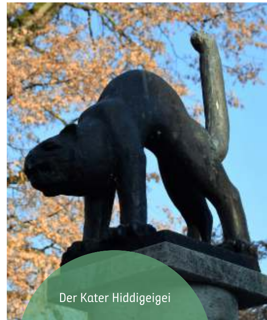
Der Kater Hiddigeigei

Diese wahre Begebenheit des 17. Jahrhunderts inspirierte den Dichter Joseph Viktor von Scheffel dazu, das Buch über den „Trompeter von Säckingen“ zu schreiben. Daraus komponierte Victor Ernst Nessler die gleichnamige Oper, die der Trompeterstadt zu weltweitem Ruhm verhalf.