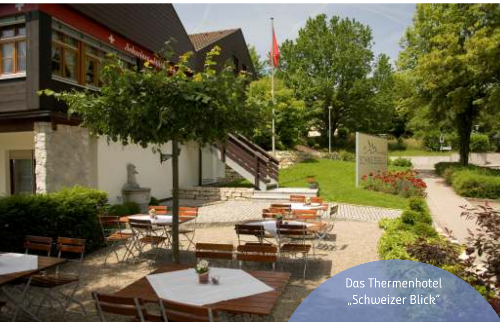
Das Thermenhotel „Schweizer Blick“