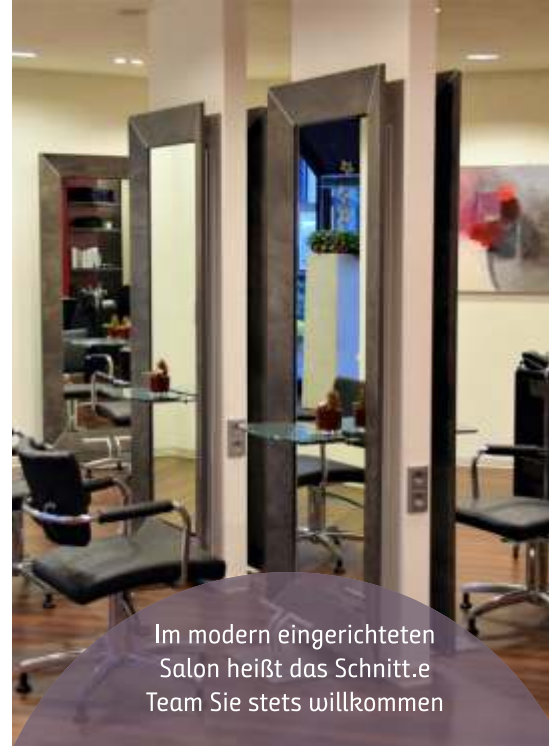
Im modern eingerichteten Salon heißt das Schnitt.e Team Sie stets willkommen