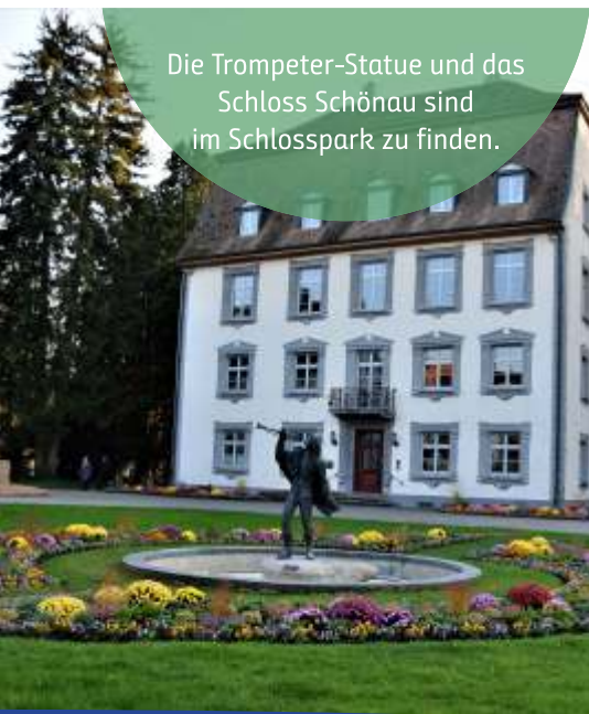
Die Trompeter-Statue und das Schloss Schönau sind im Schlosspark zu finden.