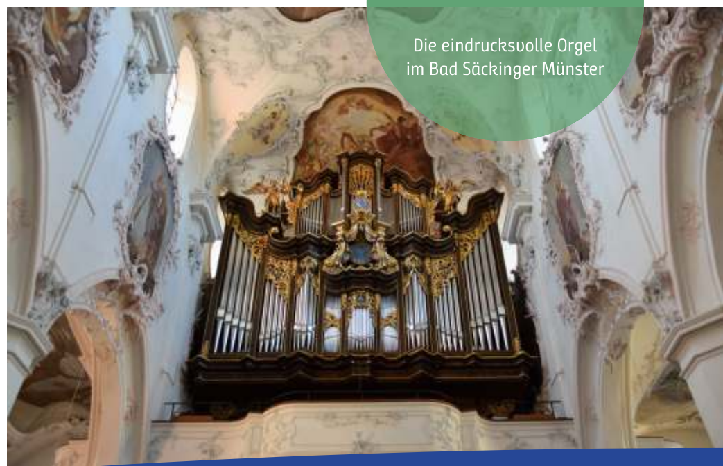
Die eindrucksvolle Orgel im Bad Säckinger Münster